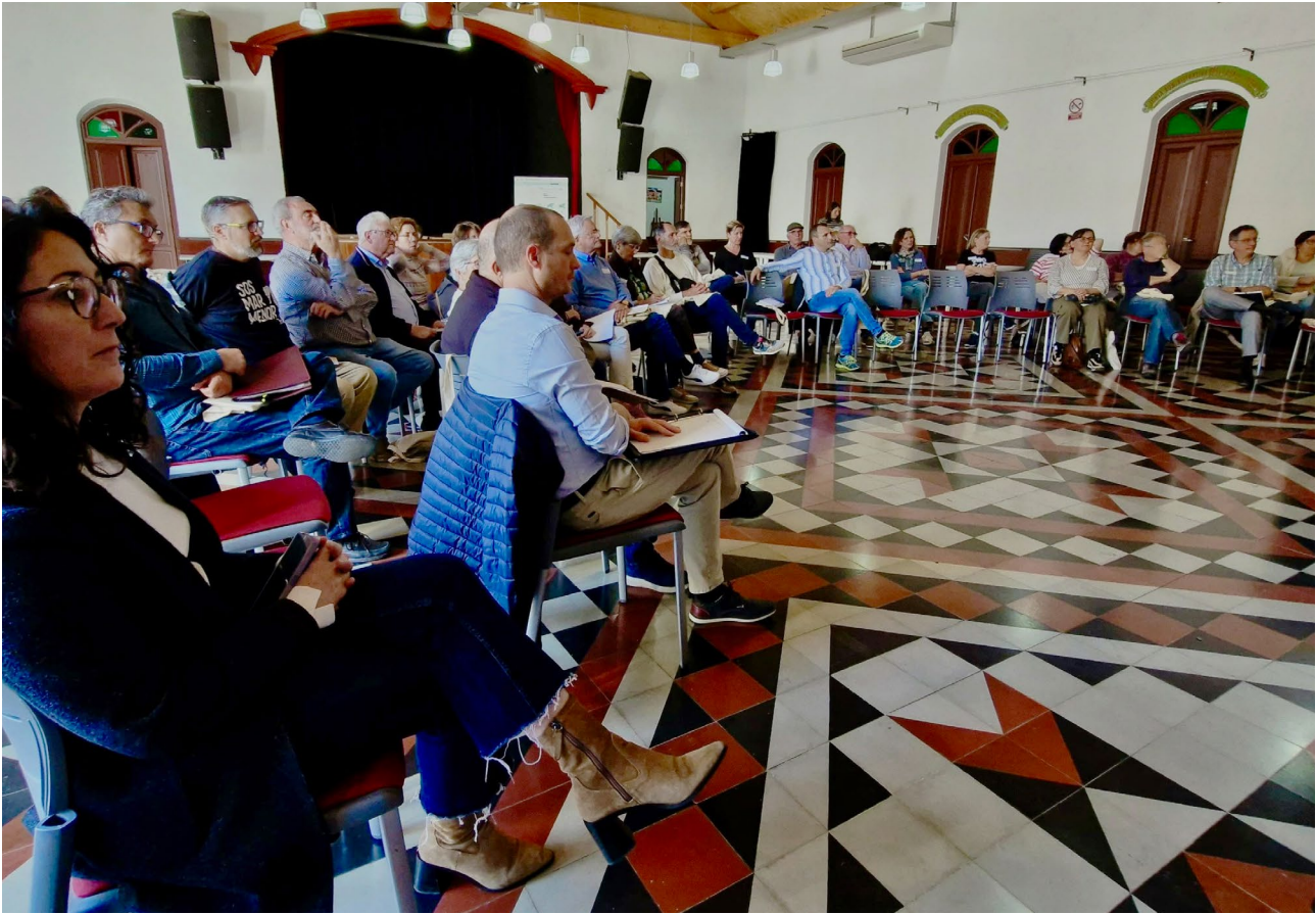
Encuentro con el sector ambiental. Casa del Pueblo de Llano del Beal (Cartagena). (31/03/2025).