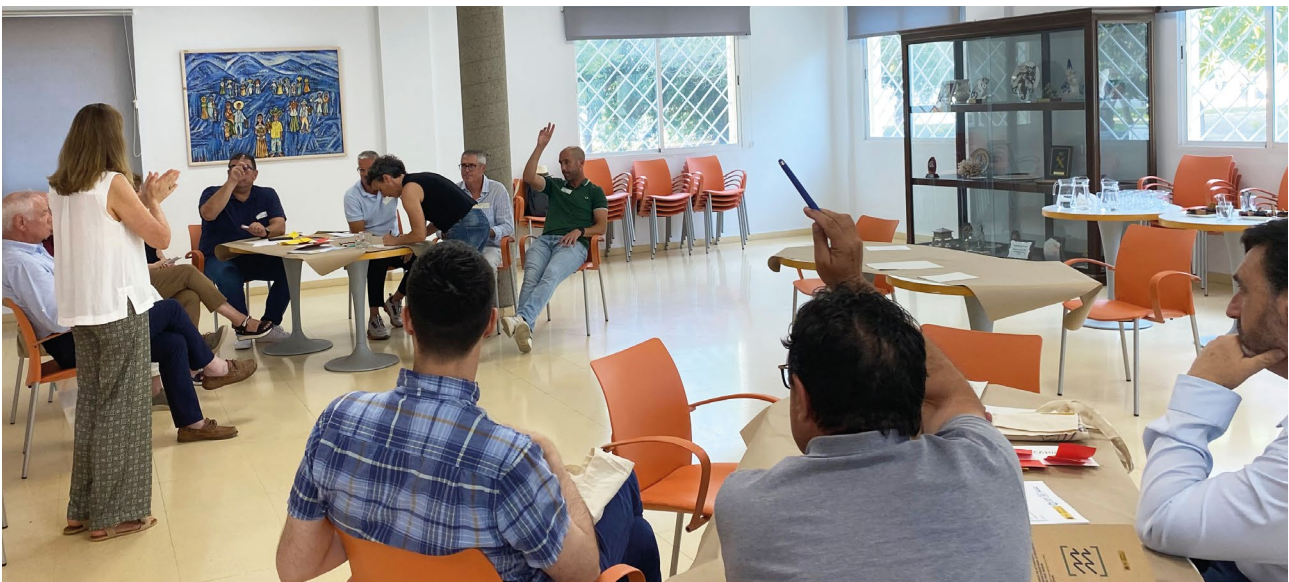
Encuentro con el sector empresarial y laboral. Centro Municipal "Las Claras" (Los Alcázares). (16/06/2025)