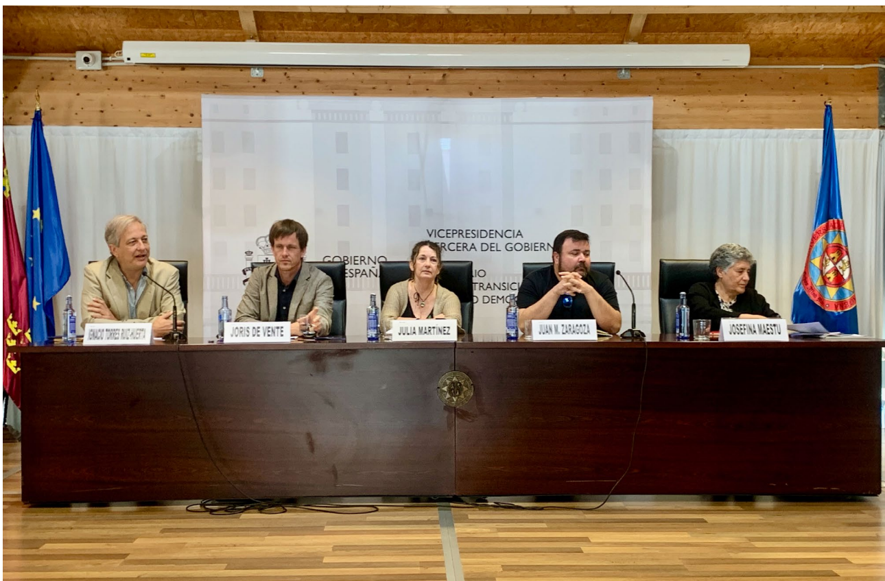
Mesa de debate sobre Mecanismos de gobernanza y participación social para la recuperación del Mar Menor en el Simposio científico. (25/04/2024)

y largo plazo para asegurar la senda de la recuperación del socioecosistema del Mar Menor iniciada por el MITECO a través del desarrollo y la ejecución del MAPMM. Sus conclusiones se hicieron públicas en agosto de 2024 y han sido consideradas en el desarrollo del proceso participativo “Encuentros por el Mar Menor” promovido en 2025 para dar cumplimiento a los objetivos de las líneas 9 y 10.