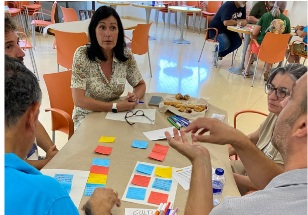
Encuentro con el sector educativo, cultural y deportivo. Centro Municipal "Las Claras" (Los Alcázares). (23/06/2025)