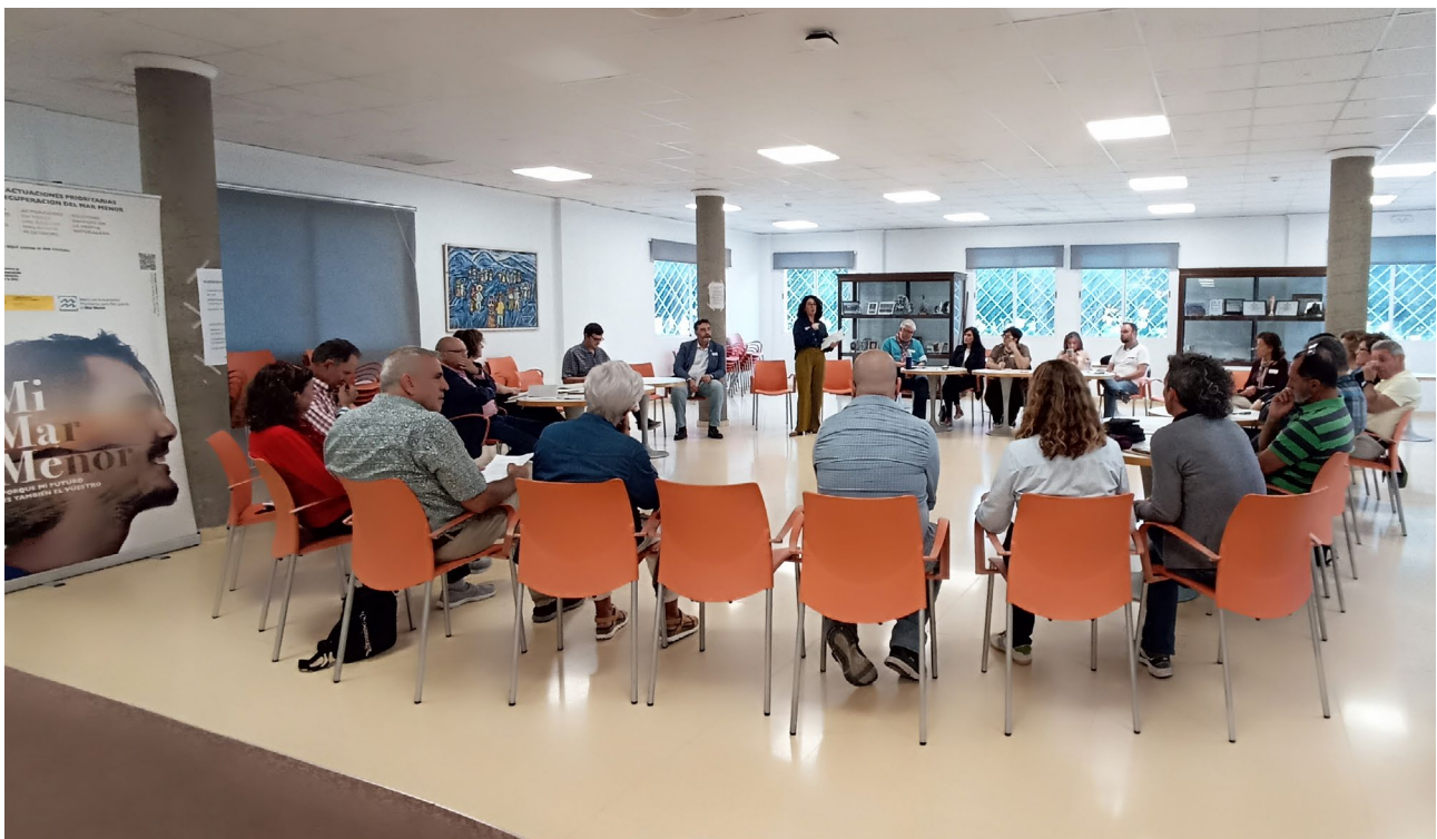
Segunda sesión de la fase II: Convergencia . Centro Municipal de Las Claras (Los Alcázares). (03/11/2025)

Del trabajo realizado por los 42 representantes se consensuó un documento de 164 propuestas organizadas en 6 grandes líneas orientadoras que se elevaron a la siguiente fase.