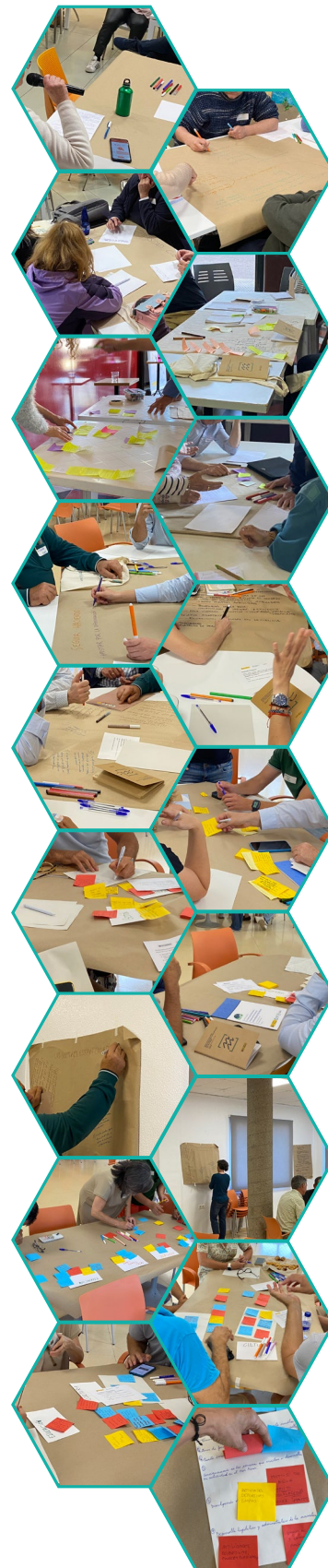
Trabajos realizados durante los encuentros sectoriales entre marzo y junio de 2025.

Garantizar el acceso a estos derechos exige una visión integral que conecte las políticas sociales, ambientales, urbanísticas y económicas con la realidad concreta del territorio. Requiere también una corresponsabilidad activa por parte de las administraciones, el tejido empresarial, el sistema educativo y la ciudadanía para generar oportunidades inclusivas y sostenibles.