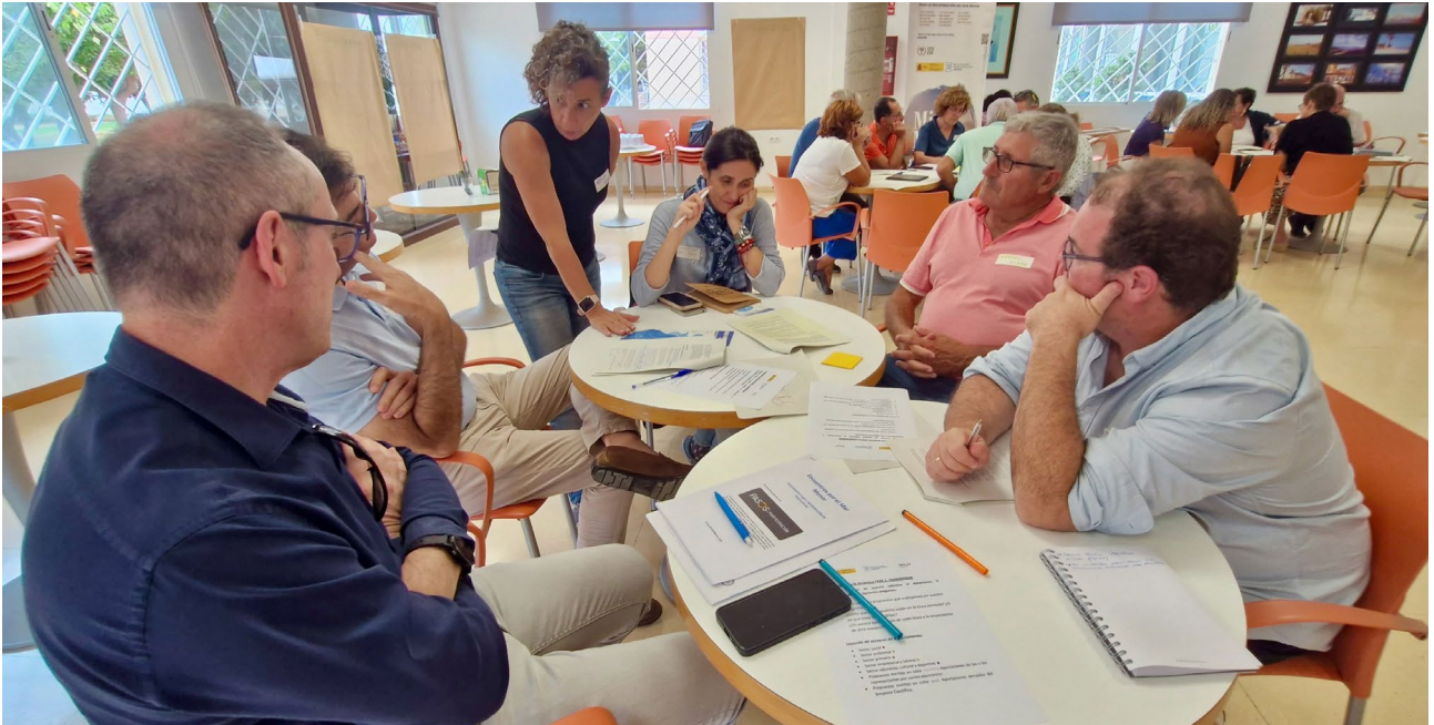
Primera sesión de la fase II: Validación . Centro Municipal Las Claras (Los Alcázares). (06/10/2025)