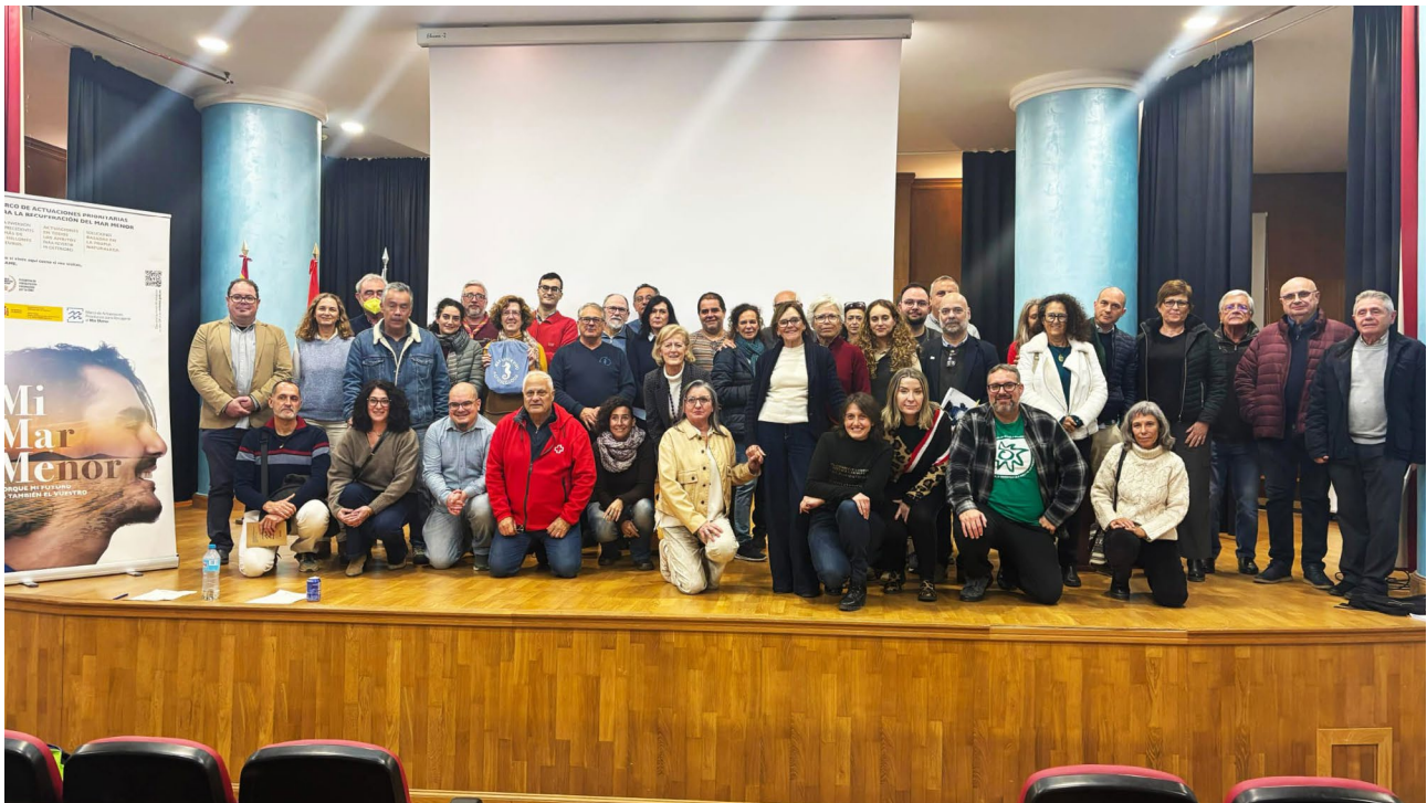
Foto de familia de los asistentes al plenario celebrado el 10 de diciembre de 2025 en el Ayuntamiento de los Alcázares.