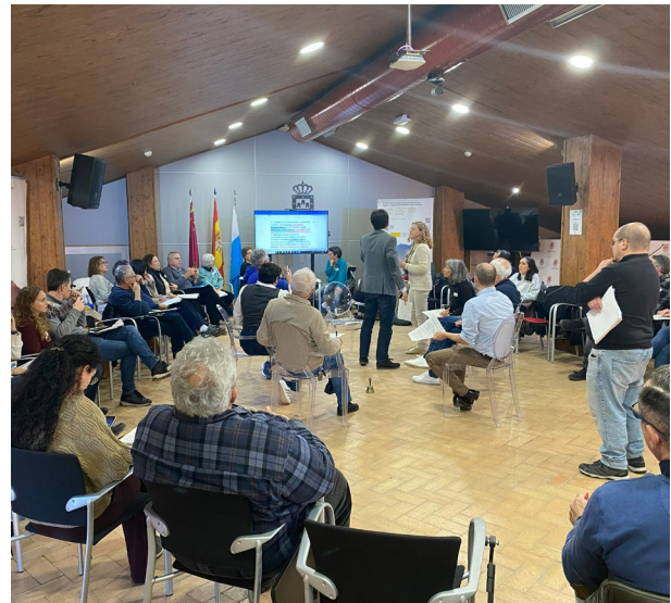
Primera y segunda sesión plenaria. Acuerdos y consensos. Ayuntamiento de Los Alcázares (10/12/2025 y 27/01/2026)