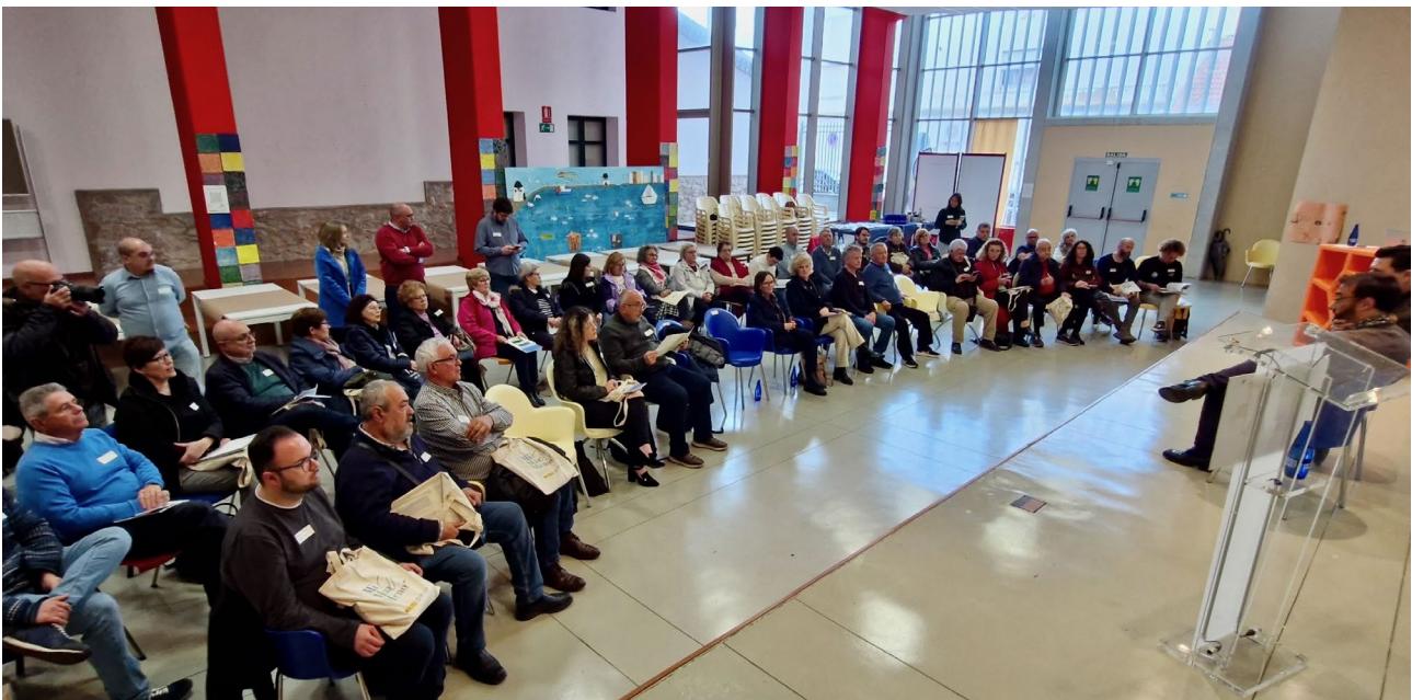
Inauguración del Encuentro con el sector Social. Centro de Juventud (San Javier) (17/03/2025)

En cada una de estas jornadas se seleccionaban las temáticas de mayor interés para realizar propuestas, así como un conjunto de actuaciones para dar solución a las problemáticas detectadas. Además, de cada sector, los propios participantes elegían a un grupo de representantes para su participación en la siguiente fase de evaluación. Fruto de dichos encuentros se generó un primer documento con un total de 228 propuestas que sirvió como documento de trabajo para la segunda fase.